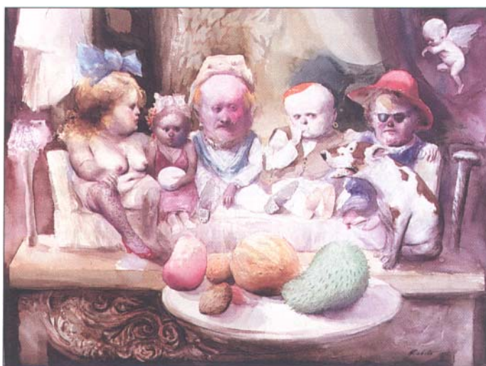
Roberto Fabelo, Pequeño teatro , 1992

de arte hemos utilizado como fronteras delimitadoras del análisis. Dentro de ellas, fuerzas de influencias se suceden para su asimilación creadora: diversos centros hegemónicos van ocupando su sitio irradiador de novedades. La asimilación creadora ha sido, con razón, vista como rasgo propio del fenómeno de la transculturación continuada, que convierte la fuente en punto de partida y no en modelo para una labor mimética.