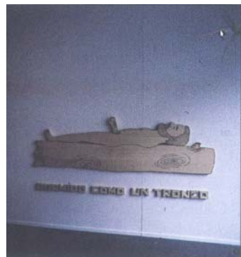
Tonel, Dormido como un tronco , 1993