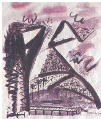
Flora Fong, de la serie Paisajes , 1983