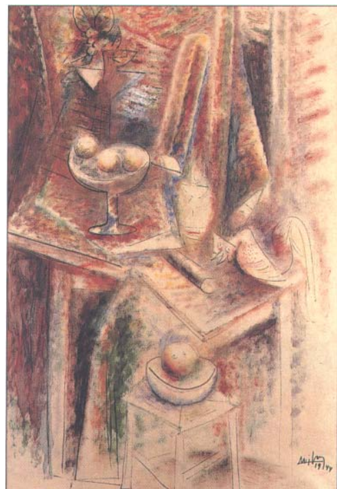
Wifredo Lam, Mesa en el jardín , 1994

El arte actual de Cuba es, pues, mosaico unitario y múltiple de proyección supranacional. Problemático de una realidad compleja y rica, ofrece en su auténtica búsqueda caminos de reflexión y disfrute. Afincado en su propia tradición y su diversidad raigal, despliega un abanico de posibilidades a la lectura múltiple de sus significantes. Obra de cambio y fijeza al propio tiempo, permanece abierta a una recepción indagatoria y enriquecedora.