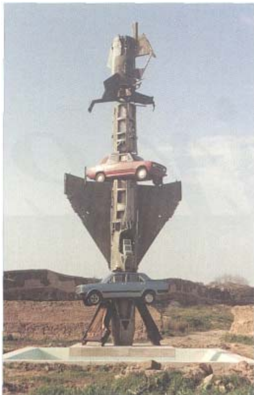
Escultura Multimedia, 1996.

del arte y la cultura. Uno de los principios de Fluxus fue precisamente la universalidad, pues todas las culturas y todas las exploraciones son válidas, siendo necesaria la ruptura de las barreras que las dividen. Fluxus, (de flujo, fluir...) nace a finales o los años cincuenta como un «movimiento sin normas, sin directrices, una experiencia libertaria y liberadora que intentaba construir, —en palabras de Di Maggio— un nuevo jardín del mundo, la infancia de un nuevo y humanísimo modo de ser, un jardín donde la creación, la anarquía y la armonía reinan allí como soberanas». Porque Fluxus era/es, más que un movimiento artístico, un estado del espíritu que erige la simplicidad como valor, que pone el acento sobre la risa y la sonrisa y que — como recuerda Ven Bautier en su pieza— da importancia a las cosas que no la tienen. En Fluxus, todo vale, sin embargo nada es imprescindible.