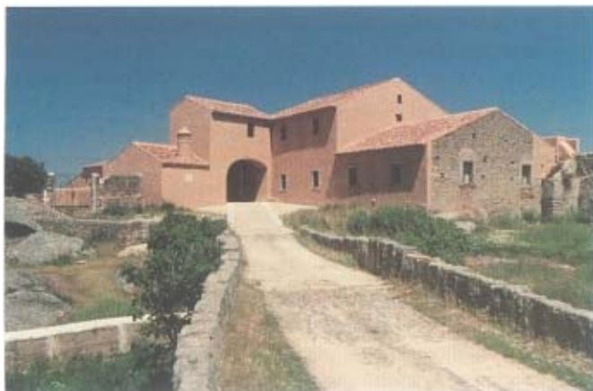
Museo Vostell, lavadero de lanas.

En los primeros años de la década de los setenta, la sociedad extremeña asiste al nacimiento de un fenómeno cultural que mostraba el deseo de nuestra región por salir del abandono finisecular al que estuvo sometida y dejaba entrever el despegue artísticocultural que vive hoy Extremadura: en abril de 1974 el artista internacional Wolf Vostell descubre el paraje de Los Barruecos en Malpartida de Cáceres, donde inmediatamente propone crear y decide apoyar con todas sus fuerzas la idea de un Museo de arte contemporáneo.