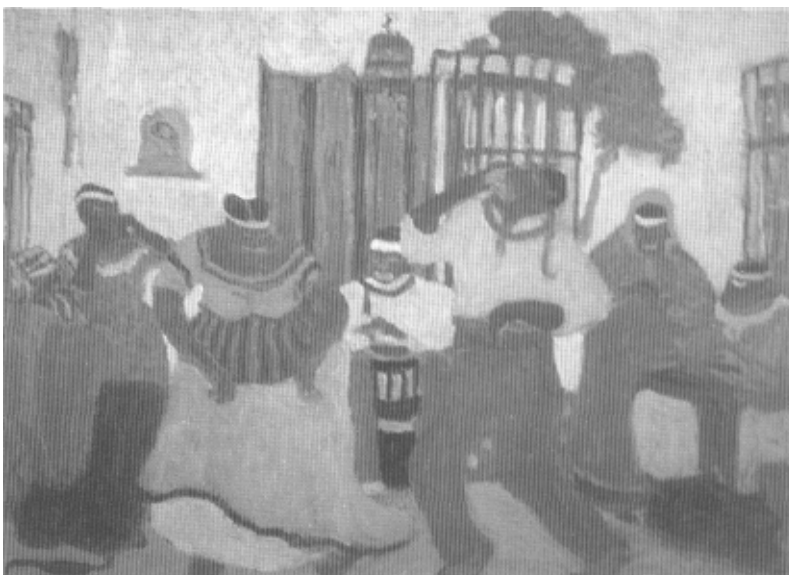
Figari, «Nostalgia africana»>>

Las personalidades diferentes y los vínculos sociales distintos de Manuel Oribe y Fructuoso Rivera, los fundadores respectivos de los dos bandos, y el principal de sus conflictos armados —la «Guerra Grande», 1839-1851— dieron nueva forma a la oposición colonial entre Montevideo y el interior rural. Los colorados (que ejercieron desde 1865 a 1958) se identificaron con Montevideo, los inmigrantes, la apertura a lo europeo y el gobierno; los blancos lo hicieron con el medio rural, sus grandes terratenientes, lo americano-criollo y las demandas políticas de toda oposición: garantías electorales.