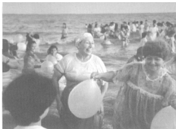
Ofrendas en el mar. La fiesta de Jemanyá.

En 1995 la población del Uruguay alcanzó los 3.150.000 habitantes, acentuándose su escaso crecimiento natural debido al alto grado de control de la natalidad que practica una sociedad urbanizada en su 89%. Además, una emigración de raíz económico-política en torno a los años setenta, costó al Uruguay el 10% de sus habitantes. La tasa de analfabetismo representa apenas el 4,25%. La calidad de vida de la mayoría de sus habitantes es de las más altas de América Latina, aventajada en ciertos rubros por Costa Rica, Cuba y Argentina. La esperanza de vida es de 73 años. La mayoría de sus habitantes es considerada católica por las estimaciones de la Iglesia, pero el número de sacerdotes no sobrepasa los 700 y la tasa de divorcios es alta, uno por cada 2,8 matrimonios.