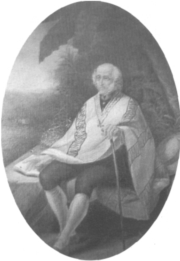
José Gervasio Artigas.

Montevideo era sede del poder español y de la sociedad más jerarquizada. Comerciantes, prestamistas, estancieros, ausentistas y altos funcionarios, formaban una clase alta que todavía recordaba los orígenes humildes de su pasado canario, vasco o catalán. Pequeños tenderos, militares, funcionarios y artesanos, integra artesanos, integraban un esbozo de clase media. Debajo de todos, el tercio de la población montevidéana era negra y esclava, proporción que las guerras de la independencia y las civiles posteriores reducirían a una mínima expresión.