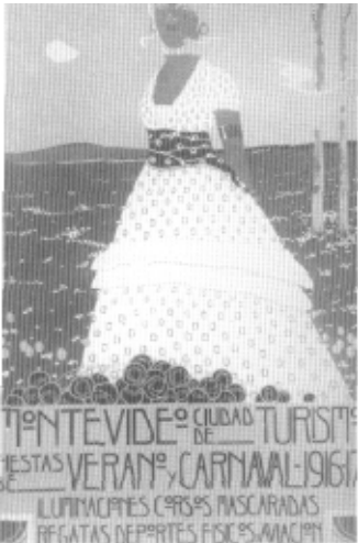
Afiche de turismo.

En octubre de 1828 se firmó la Convención Preliminar de Paz entre Brasil y la Confederación Argentina por la cual se declaró al Uruguay estado independiente. En el origen de este hecho se combinaron, en dosis que la historiografía discutirá luego, el interés británico y el sentimiento oriental de autodeterminación que tenía, por cierto, raíces lejanas.