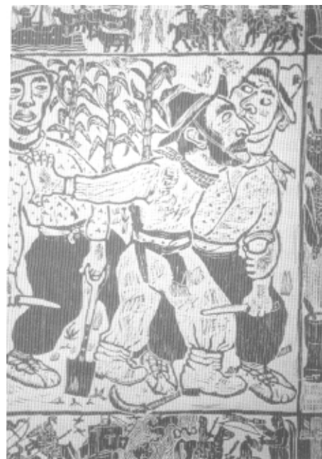
Carlos González, Duel , Grabado de madera

En 1861 la Iglesia Católica comenzó a perder su jurisdicción sobre los cementerios; en 1879 el estado decidió llevar los registros del Estado Civil; en 1885 se instituyó el matrimonio civil obligatorio y previo a la ceremonia religiosa optativa. En 1907 se aprobó la primera ley de divorcio, en 1913 el divorcio por la sola voluntad de la mujer y en 1909 se suprimió todo rastro de enseñanza religiosa en las escuelas estatales.