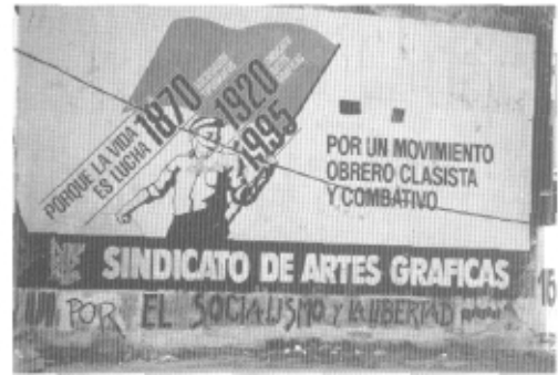
Mural en las calles de Montevideo