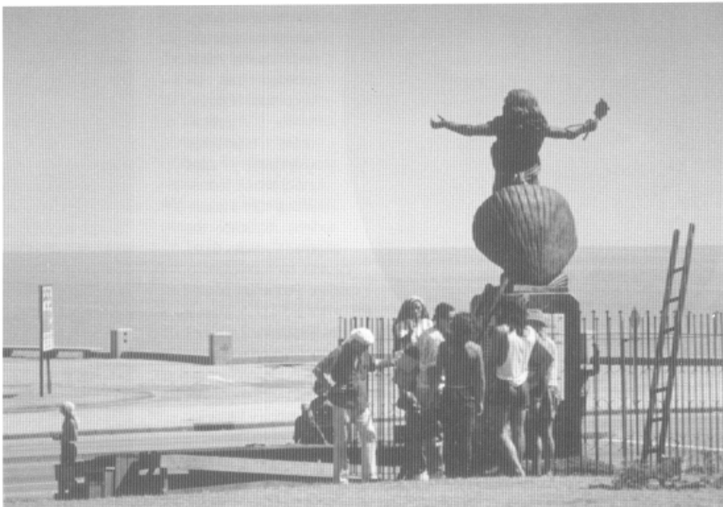
Mirando el mar. Escultura de Jemanyá en la rambla de Montevideo.

La tradición historiográfica afirma que el año 1831 es aquel en que desaparecieron los charrúas —la etnia de mayor peso— al ser aniquilados por las tropas del primer gobierno del Uruguay independiente. Esa destrucción no impidió que la sangre indígena guaraní, procedente del norte, penetrara en ciertas capas de la población campesina del país. De cualquier modo, el «exterminio» de los indígenas de 1831 fundó el mito del Uruguay europeo y blanco que las clases dirigentes del país alimentaron, tanto más cuanto la inmigración europea fue, en efecto, la base del crecimiento demográfico uruguayo.