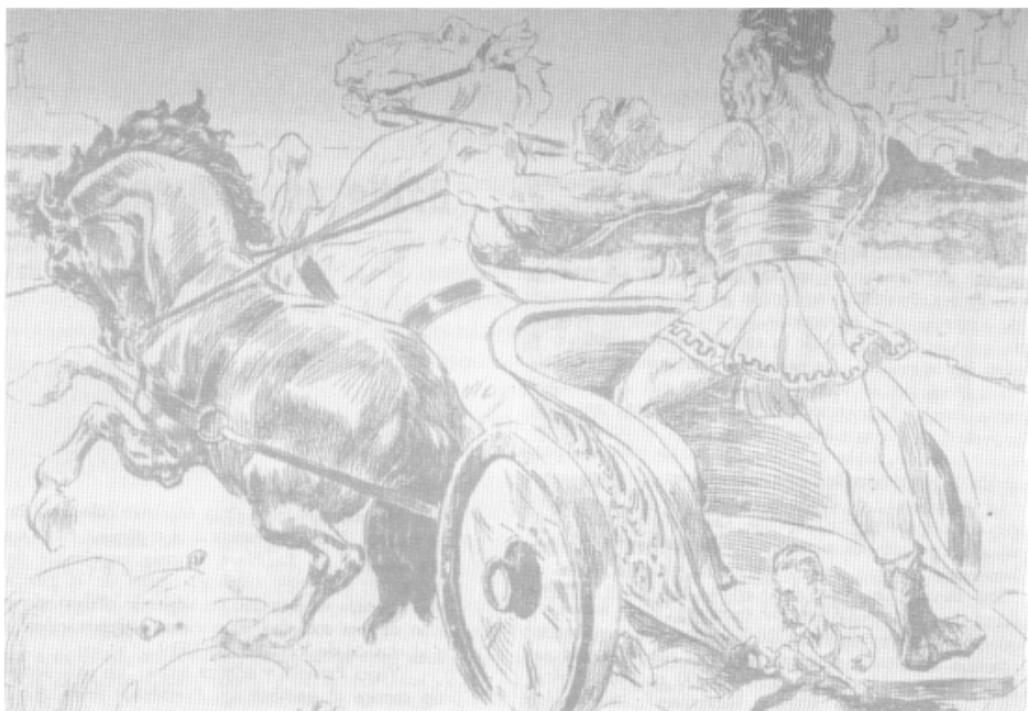
veamos si este gladiador coloso / tal como le llamó la opinión pública / dirige con carácter vigoroso / la carroza triunfal de la República., Caricatura de << La Semana t.

Existían tensiones. La autoridad española impedía a los estancieros la libre venta de sus cueros a los comerciantes ingleses y portugueses, y a menudo los amenazaba con cobrarles las tierras que poseían con deficientes títulos de propiedad o sin ellos. A comerciantes y ganaderos molestaba la sujeción a las autoridades residentes en la vecina, competidora y envidiada Buenos Aires.