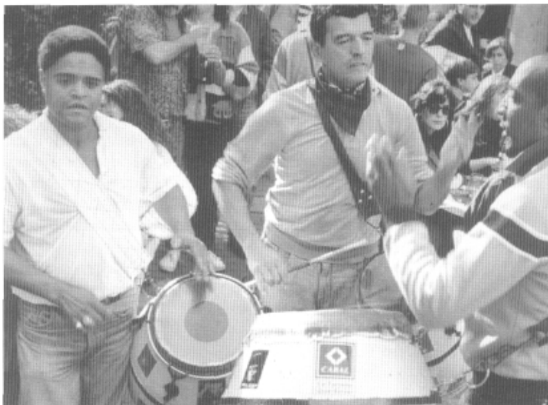
Tambores en el Mercado del Puerto.

En elecciones en que hubo candidatos vetados por las Fuerzas Armadas, surgió como presidente constitucional el líder colorado Julio María Sanguinetti. Bajo su presidencia (1985-90) y la de su sucesor, el blanco Luis A. Lacalle (1990-95), se fortificaron las instituciones democráticas y políticamente el país tendió a dividirse en tercios: colorados, blancos y frenteamplistas.