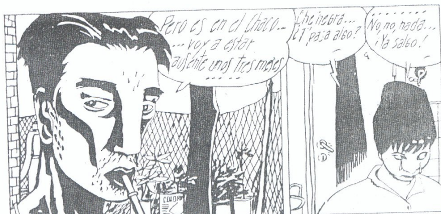
<<Sudor Sodaca>>, guión de Carlos Sampayo y dibujos de José Muñoz, FIERRO, 1986

En síntesis, Fierro fue un medio rico y complejo que, como suele suceder en estos casos, llegó en el momento y las circunstancias justas. En ese sentido se coloca en la tradición de las revistas del género que marcaron y reflejaron una época. También, por eso mismo, dejó de aparecer cuando esa realidad se desdibujó o el impulso que lo había generado habían perdido aliento o sentido. Quedó una obra diseminada en multitud de personajes y autores notables, los que caracterizan hoy a ese período singular de la historia política y cultural de América Latina que son los años ochenta.