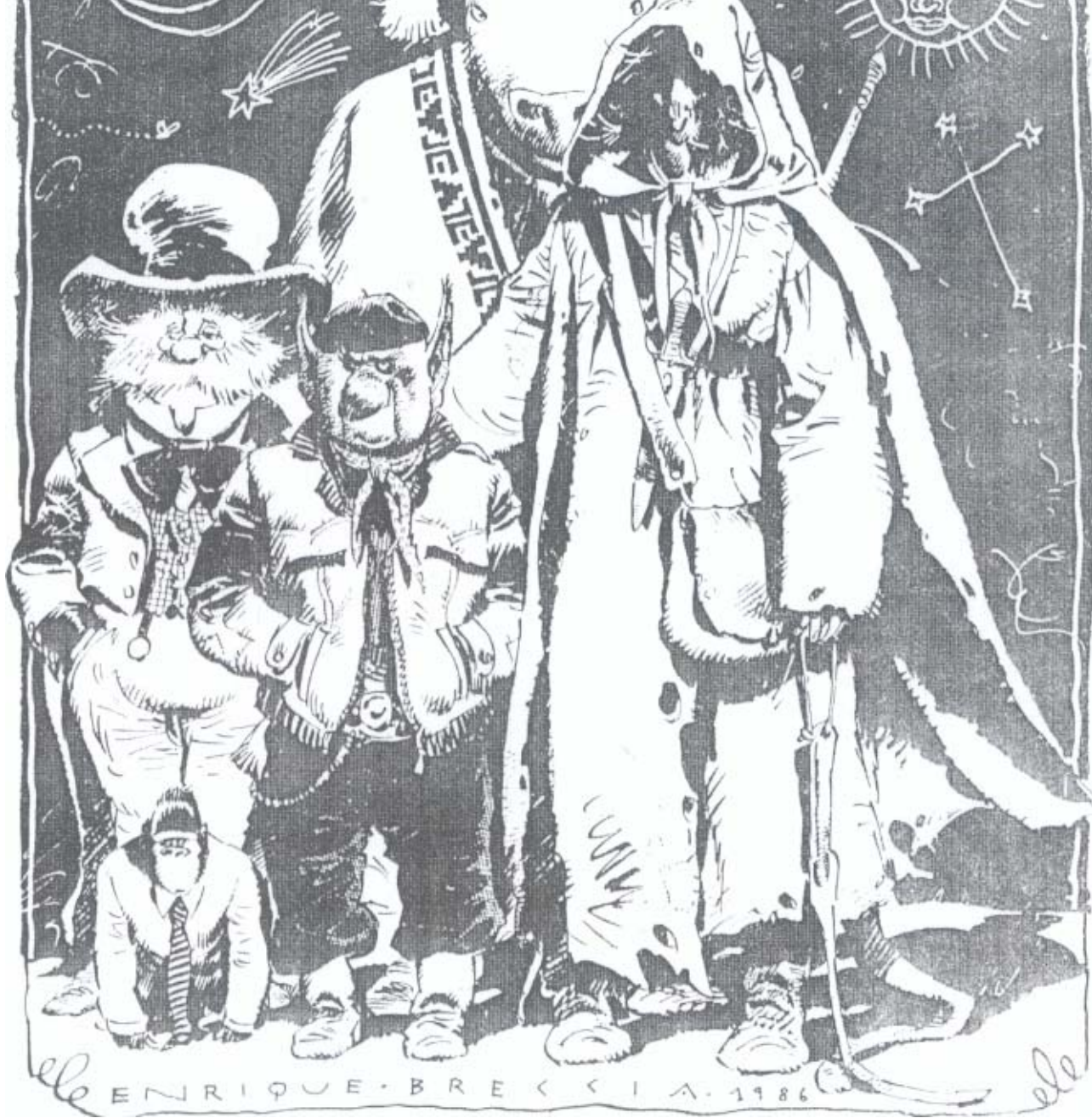
Enrique Breccia El Sueñero, FIERRO, 1986.

tiva Mutantia , el semanario infantil Humi y la revista de historietas SuperHum(R) , creada como suplemento de la publicación madre en 1979, y antecedente inmediato de Fierro .