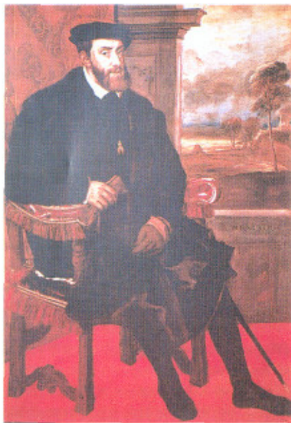
Carlos V. Retrato de Tiziano.

CARLOS V, GANTE (Bélgica) 1500, YUSTE (España) 1558